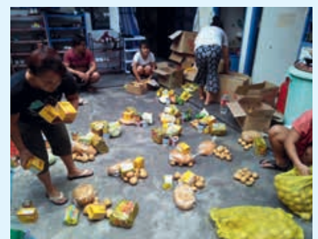
MALAYSIA: SI Petaling Jaya leverer ut fersk frukt, egg, nudler og grønnsaker til tre barnehjem.