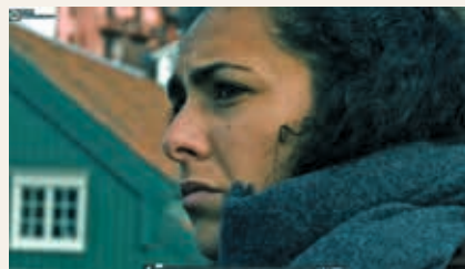
FILMSNUTT: fra filmen, «Listen».