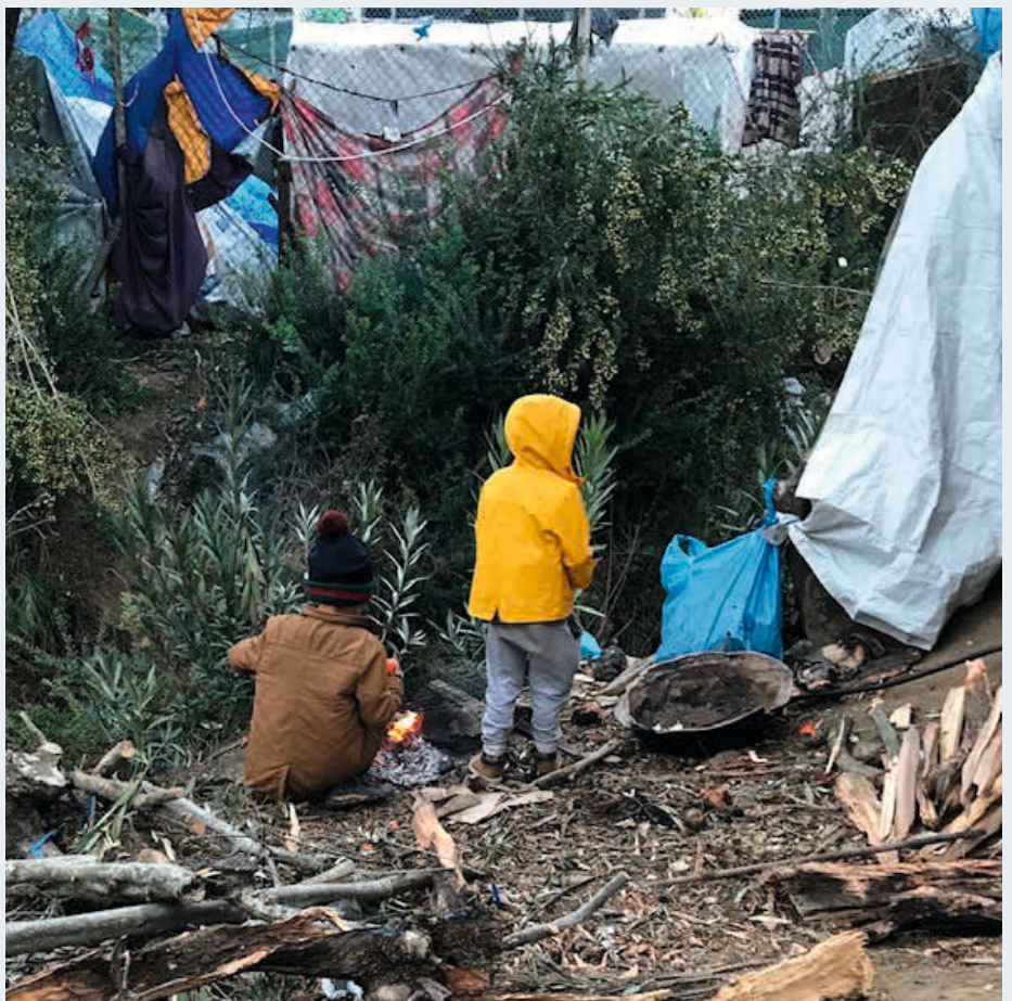
LEIREN: Barn i Moria leiren.