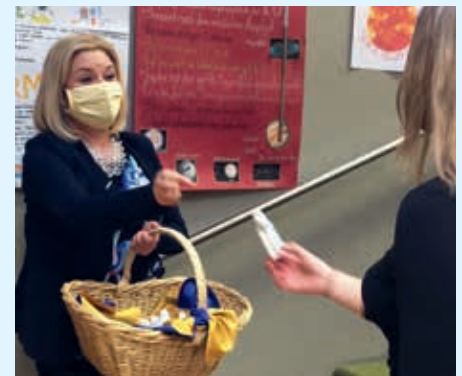
ANTIBAC FOR STUDENTER: Soroptimistklubben i Innsbruck gir nyutdannede videregående studenter antibakteriell gel.