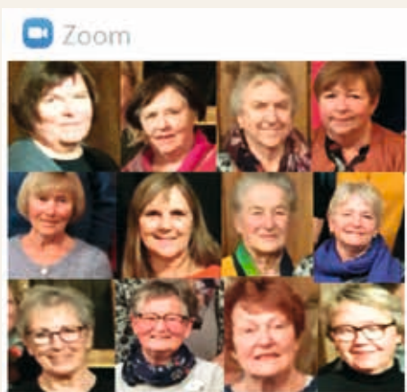
DIGITALE KLUBBMØTE: Mange medlemmer i Kristiansundsklubben deltok i mai-møtet via Zoom.

Ved nedstengingen av Norge på grunn av korona-pandemien, bestemte styret i Kristiansund Soroptimistklubb at det ordinære april møtet måtte avlyses, og sannsynligvis også maimøtet.