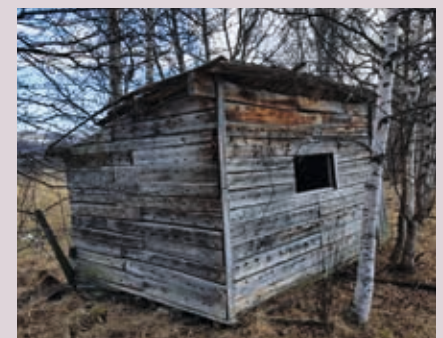
FLYPLANK: Huset bygd etter krigen, Alta.

Hva sier dette oss? På den ene side, at menneskets vesen er uforanderlig i sin grusomhet. På den annen side, at vi ikke må glemme at denne skapningen også bærer i seg evnen og drivkraften til samarbeid og håp for fremtiden.