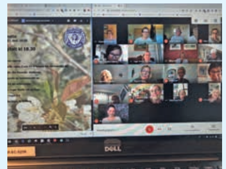
LARVIK KLUBBMØTE: Medlemmer møtes på Google Meet .