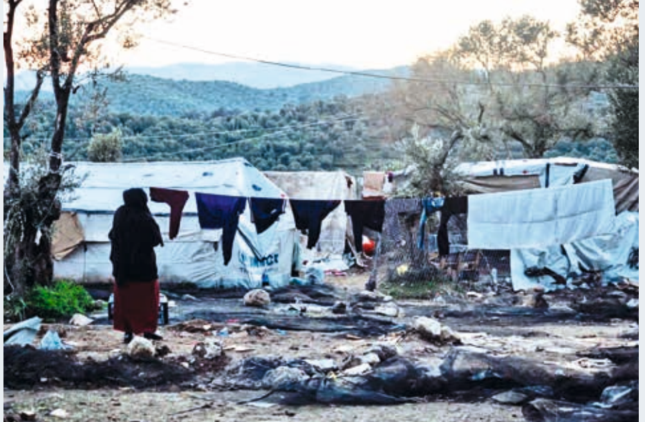
MORIA LEIREN: Forholdene på øyene er ekstremt krevende, særlig for kvinner og barn.